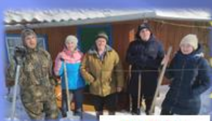
11 и 10 класс