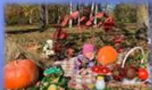
Стоп- кадр. Настя и ее команда создали 3 фотозоны.