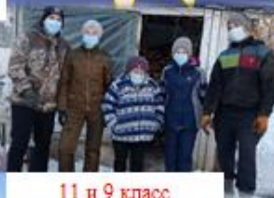
11 и 9 класс