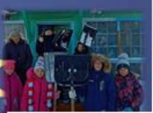
10 и 4,5 класс