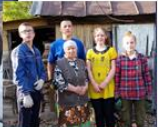
10 и 7класс