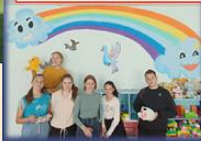
В школе отсутствуют конфликты. Атмосфера дружеская.